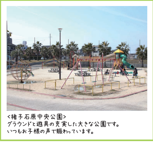
<猪子石原中央公園> グラウンドと遊具の充実した大きな公園です。 いつもお子様の声で賑わっています。