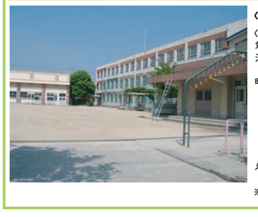
<香流小学校> <トワイライトスクール> 対象/参加を希望する小学生 活動日/月曜日～土曜日 (休日・年末年始を除く) 時間/授業のある日 =放課後～午後5時 /夏休み等の長期休業日 (土曜日を除く) =午前8時～午後5時 /土曜日 =午前9時～午後5時 参加料/無料 (保険関係費が必要) ※選択専業の時間・費用は異なります