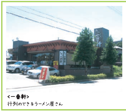
<一番軒> 行列のできるラーメン屋さん