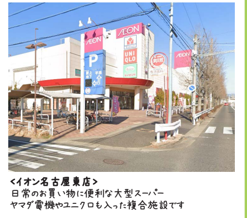
<イオン名古屋東店> 日常のお買い物に便利な大型スーパー ヤマダ電機やユニクロも入った複合施設です