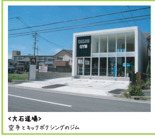
<大石道場> 空手とキックボクシングのジム