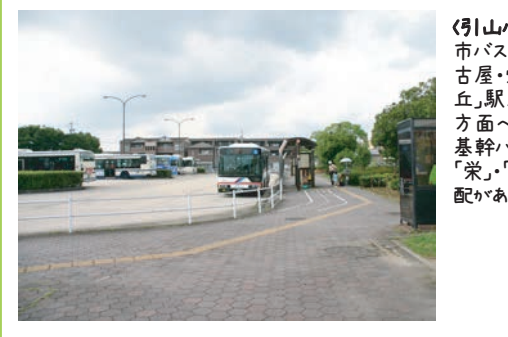
<引山バスターミナル> 市バスと名鉄バスにて地下鉄「名古屋・栄・一社・上社・本郷・藤ヶ丘」駅及び瀬戸・尾張旭・長久手方面へアクセス自由自在 基幹バスは専用バスレーンで「栄」「名古屋」駅まで渋滞の心配がありません