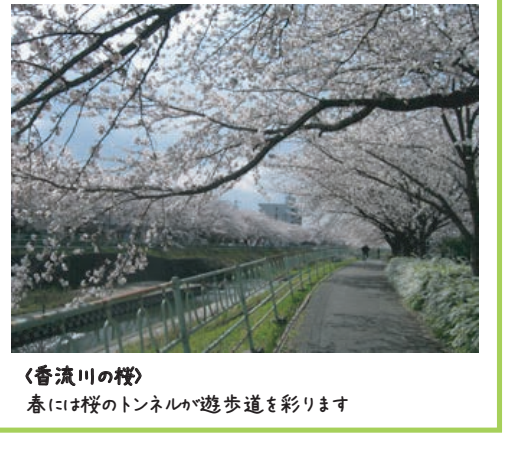
<香流川の桜> 春には桜のトンネルが遊歩道を彩ります