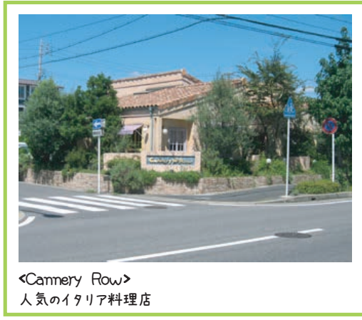
<Camery Row> 人気のイタリア料理店

基幹バス利用で 名古屋市内はもちろん、尾張旭・瀬戸・長久手など アクセス自由自在！(市バス・名鉄バス)